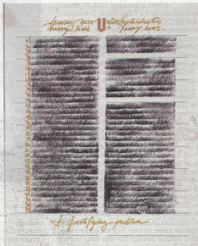
Mircea Stănescu - Heavy Rows, 2020